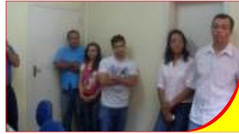
Juizado de Juazeiro

As cidades já visitadas foram Senhor do Bomfim, Juazeiro, Jacobina, Irecê, Itaberaba, Ipirá e Alagoinhas. Durante essas visitas os questionamentos são inúmeros e a troca de ideias, informações e experiências são fundamentais para o crescimento de qualquer entidade sindical.