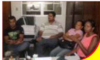
Juizado de Jeremoabo

da capital (já que no Interior do Estado já vem sendo feito esse trabalho de outra maneira), onde um mínimo de 03 Coordenadores estará presente respondendo aos questionamentos dos servidores e da unidade em si. Os encontros serão gravados e exibidos posteriormente no site. Os locais de cada semana