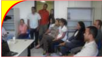
Juizado de Senhor do Bomfim

Desde o final do mês de março, a Coordenadoria Executiva do SINTAJ retomou suas viagens pelo Interior do Estado com o intuito de visitar as 38 comarcas onde existem Juizados Especiais.