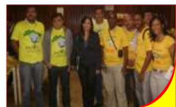
Mobilização em Brasília