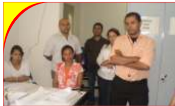
Juizado de Paulo Afonso

É com base nessas experiências que a Coordenadoria Executiva do SINTAJ está lançando a campanha O SINTAJ quer ouvir você . A campanha consiste em pequenos encontros a serem realizados às sextas-feiras em uma das unidades