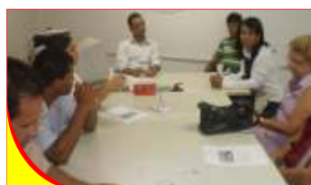
Juizado de Alagoinhas

minuto onde ele poderá emitir sua opinião acerca de qualquer assunto relacionado ao Judiciário baiano e/ou ao SINTAJ que será exibida sem cortes, desde que não haja nenhum tipo de ofensa pessoal.