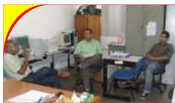
Juizado de Jacobina

serão divulgados com dois dias de antecedência para que a unidade se organize para o evento. O horário desses encontros será sempre o mesmo – das 12h às 14h (final e início do expediente para atrapalhar o mínimo possível o funcionamento da unidade e atender aos dois turnos). Nesse dia, seria interessante que os servidores do turno vespertino chegassem às 12h e os do turno matutino saíssem às 14h para que o maior número de servidores possa participar.