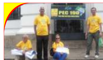
Mobilização em Salvador