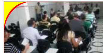
Delegados em ação 1

Coordenadoria Executiva uma pauta de reivindicações para o ano de 2011. Os pontos de pauta aprovados foram os seguintes: