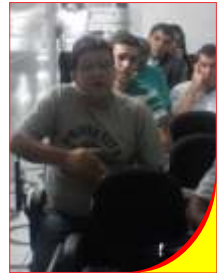
Delegados em ação 2

Ainda existem muitas unidades sem Delegado Sindical e seria