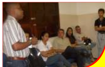
Juizado de Irecê

Ao final de cada encontro, o servidor terá a oportunidade de conceder uma entrevista de 01